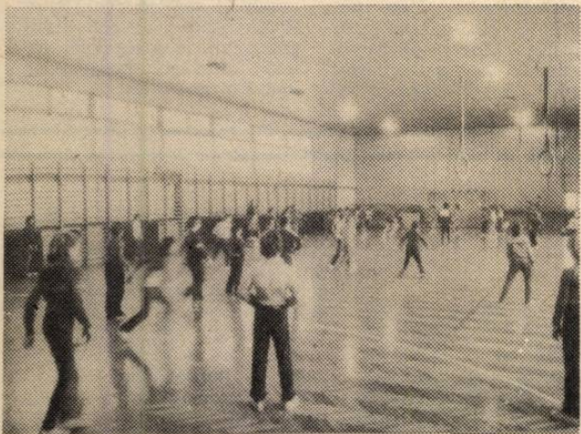
Az 1-es számú Általános Iskola tornatermében játszó gyermekek sajnos nem öltözhetnek tornadresszbe...